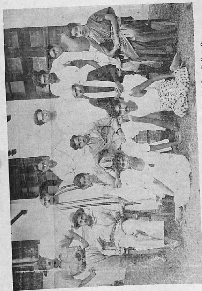
Cast of "പ്രഭാതം" by Mr. E. V. Krishna Pillai staged on College Day.